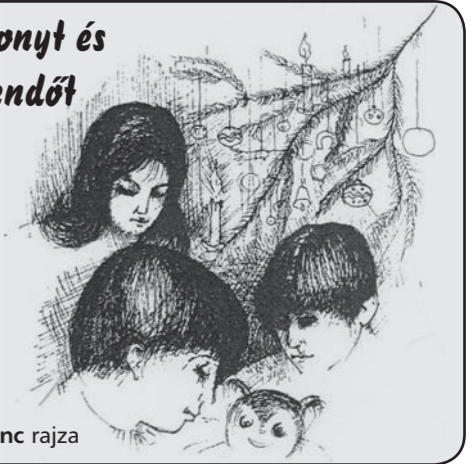
Vörös Ferenc rajza

Boldog karácsonyt és sikeres új esztendőt kívánunk minden Kedves Olvasónknak!